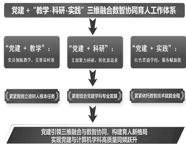
图 2 党建+“教学—科研—实践”三维融合数智协同育人工作体系

(2) 打通科研成果转化“最后一公里”。以“支部建在科研团队上”为组织保障，组建“党员科研先锋队”对接企业需求清单，推动党建力量下沉产业一线，通过“支部牵线、党员牵头、校企联建”机制打通从实验室到生产线的转化通道，解决“供需错位”问题，让科研创新彰显科技报国的党建底色。