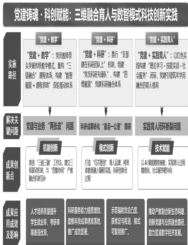
图 3 主要经验示意图

(3) 完善实践育人体系。“红色实践+专业服务”模式，为计算机学科“学用融合”实践体系提供核心思路，其校企合作教材、知识图谱课程推动课程思政与数智技术融合标准化。（项目主要经验如图3所示）