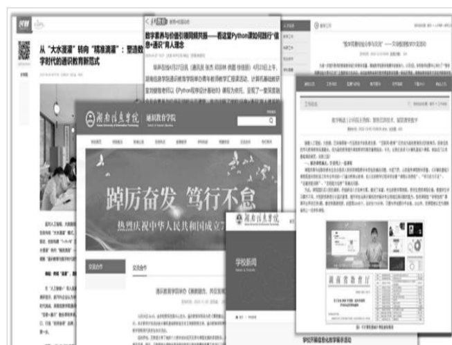
图 3 教师教学影响与示范

等共计 3 项,基于该平台开展各类教学竞赛获省级及以上荣誉 4 项,部分宣传报道如图 3 所示。