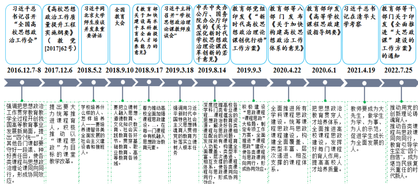
图 1 课程思政演进与发展脉络

从“三全育人”，到“四个服务”“四为”方针，再到“全体系”（构建高校思政工作体系） [18] ，从图1可以看出，党的“十九大”以来，课程思政被摆在了思政教育工作格局中更为重要的位置上，为高校和专业教师开展思政育人提供了关键理论指导，开辟了有效路径。