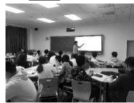
图 1 雨课堂答题及学生课堂场景

团队成员设计了同伴教学法的应用案例,并借助雨课堂进行实施。在每次上课前,要求学生做好充分的预习准备,在课堂上,教师被提前把难点的地方进行分解,阶段性的向学生抛出一些精心设计的概念性问题。这些问题通常是容易产生困惑和误解的地方,学生利用几分钟的时间来形成和组织自己对这些问题的答案,然后通过小组的讨论合作来达成共识,小组的讨论通常能够让参与其中的同学对概念进行解释,